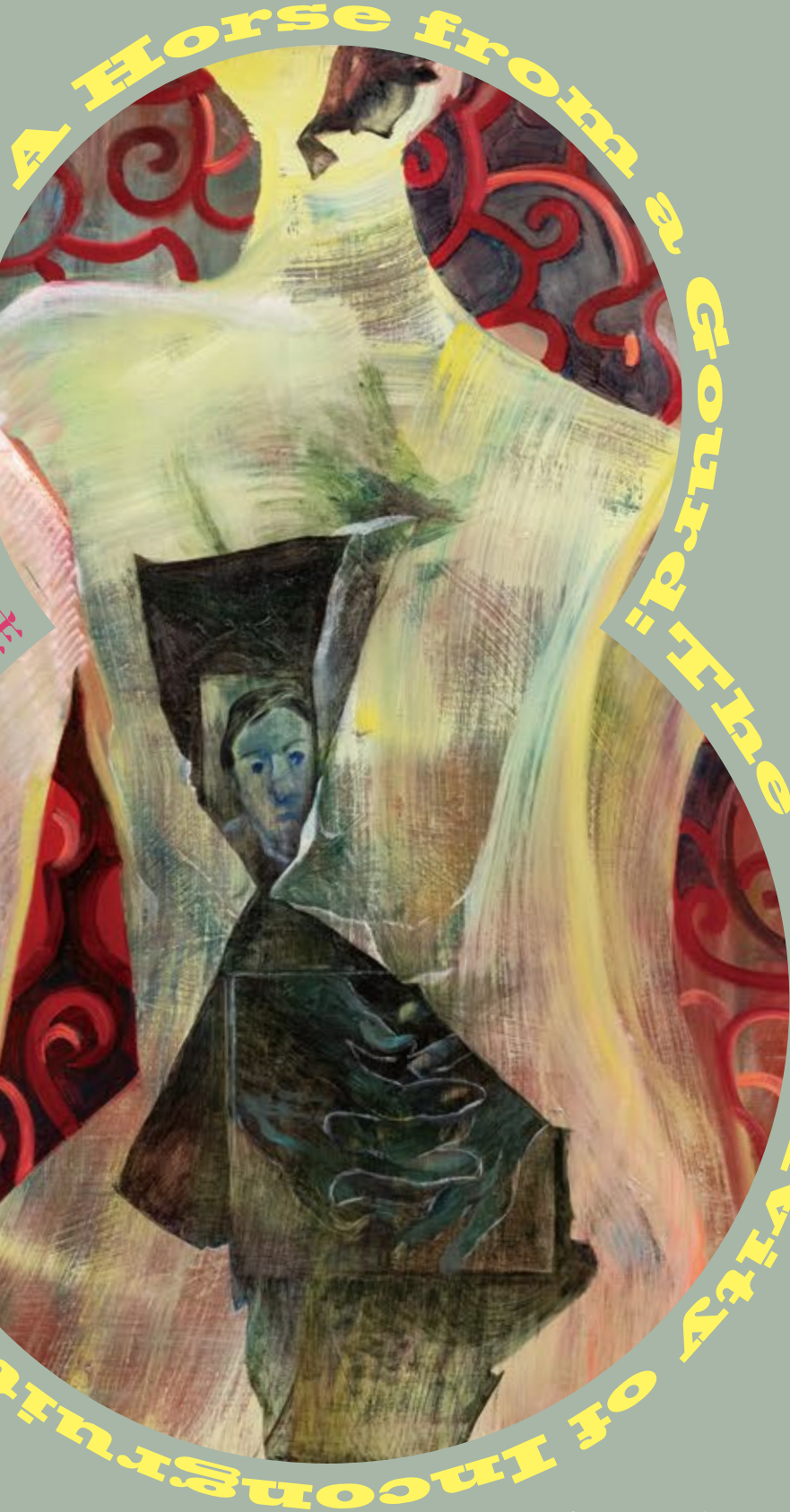
出品 | 高橋 郭 (たかはし かく) | 2023 | 油彩 | 横断